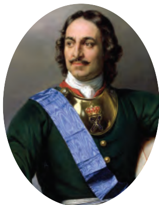
Император Петр I

Сообщениями «о похищении казны» первоначально занималась тайная канцелярия во главе с графом П.А. Толстым. И работала она на совесть. Но были и такие дворяне и чиновники, которые к проблеме мздоимства относились гораздо терпимее. По рассказам современников, однажды в Сенате Петр пригрозил издать указ, по которому всякий, кто украдет у казны сумму, на которую можно купить веревку, будет повешен. Генерал-прокурор Ягужинский на это заметил: «Неужели вы хотите остаться императором без служителей и подданных? Мы все воруют — с тем только различием, что один больше и приметнее, чем другой».