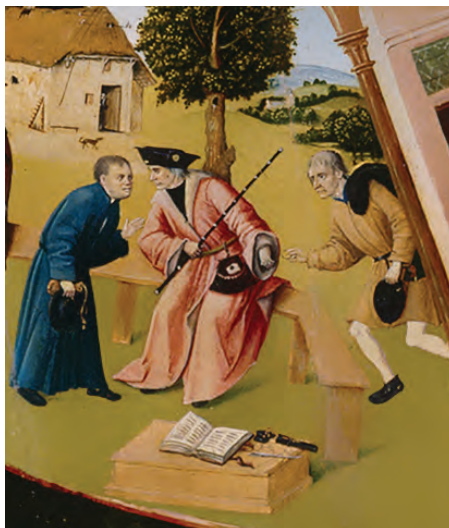
Фрагмент «Алчность» картины Иеронима Босха «Семь смертных грехов»

Рассматривая участников коррупции на примере взяточничества, стоит отметить, что в коррупционном процессе всегда участвуют две стороны. Одна сторона — это взяткополучатель (подкупаемый). Вторая сторона — это взяткодатель (осуществляющий подкуп). Также в процессе может участвовать и третья сторона — посредник.